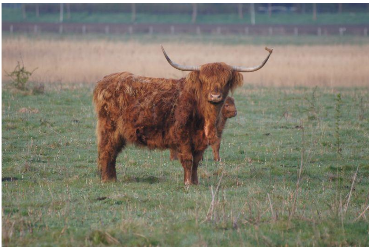
Schotse Hooglander voorjaar 2013