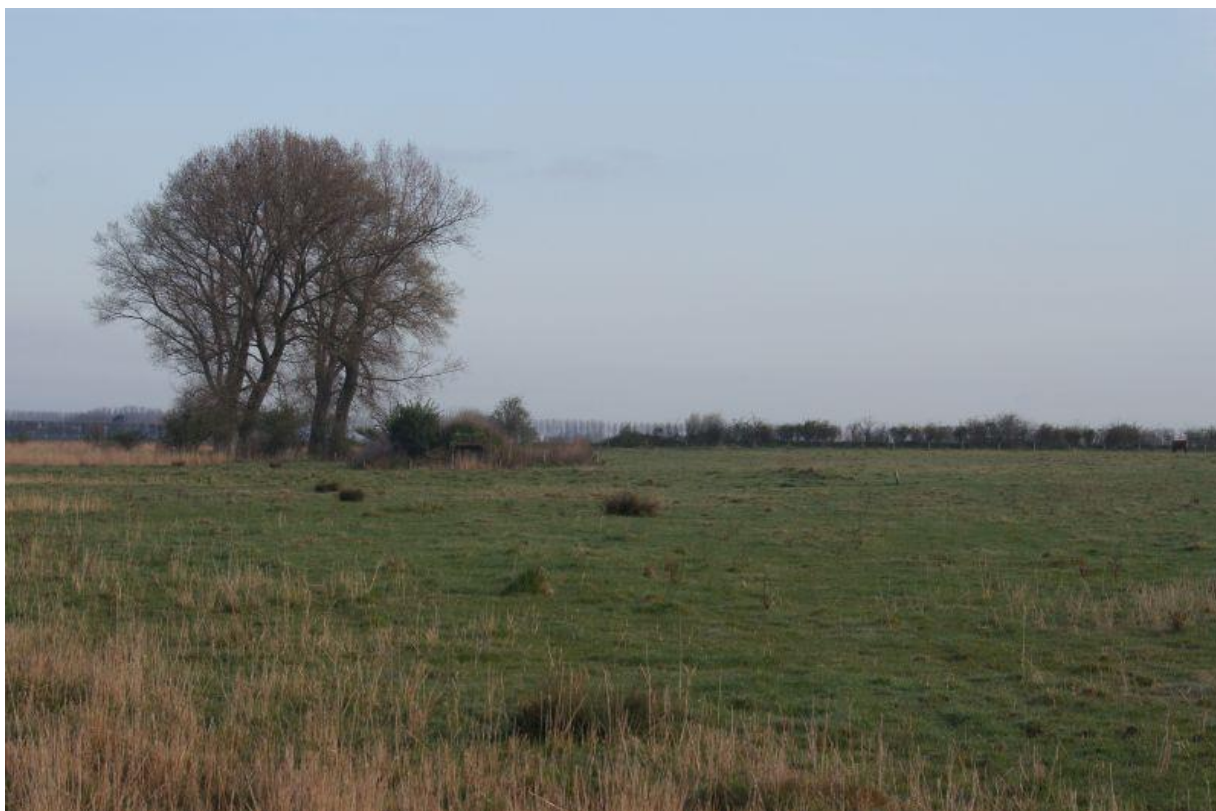
De hoge bomen waar in 2013 voor het eerst een Buizerd tot broeden kwam.