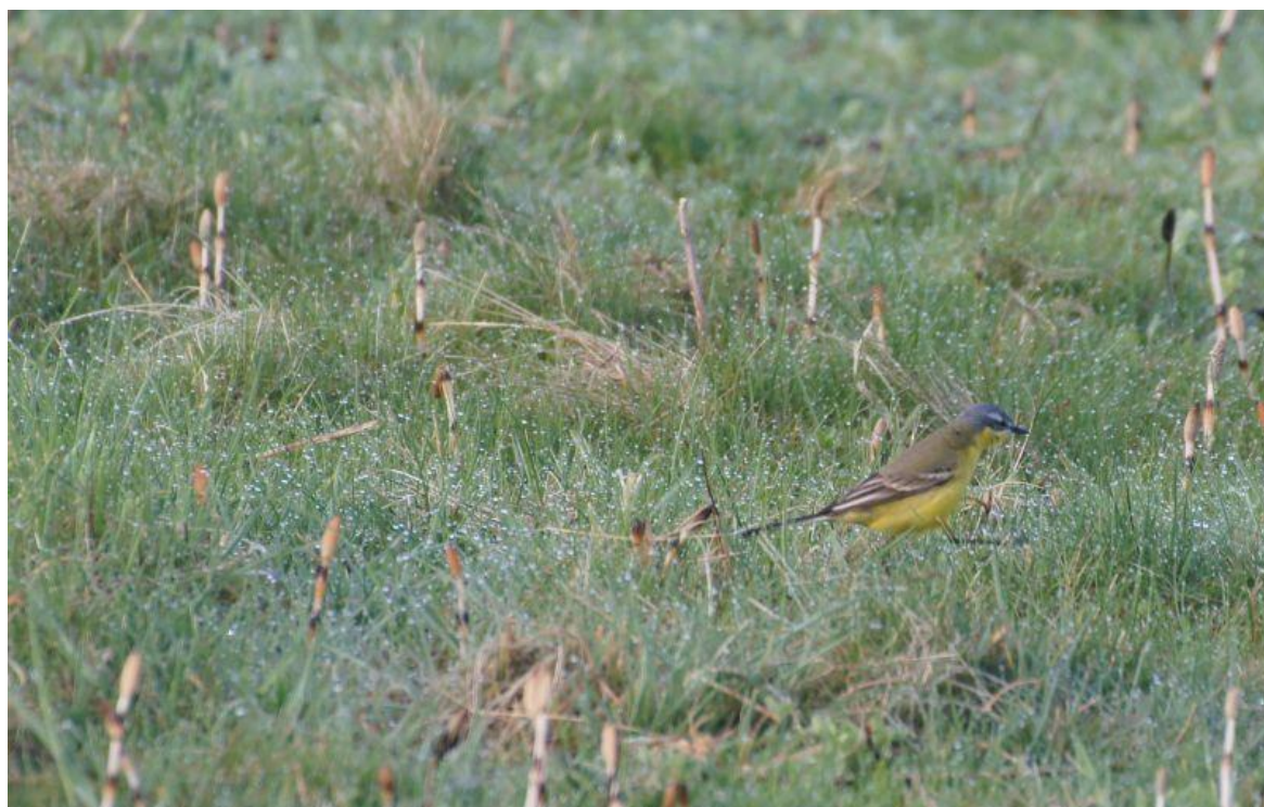
Foeragerende Gele Kwikstaart

Zie voor de soortkaarten de bijlage 2013_SOVON_wsn_territoriumkaarten_5232_Gat_van_Pinte__Zaamslag.pdf